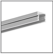
PDS-4-PLUS Profile Ref: C1263